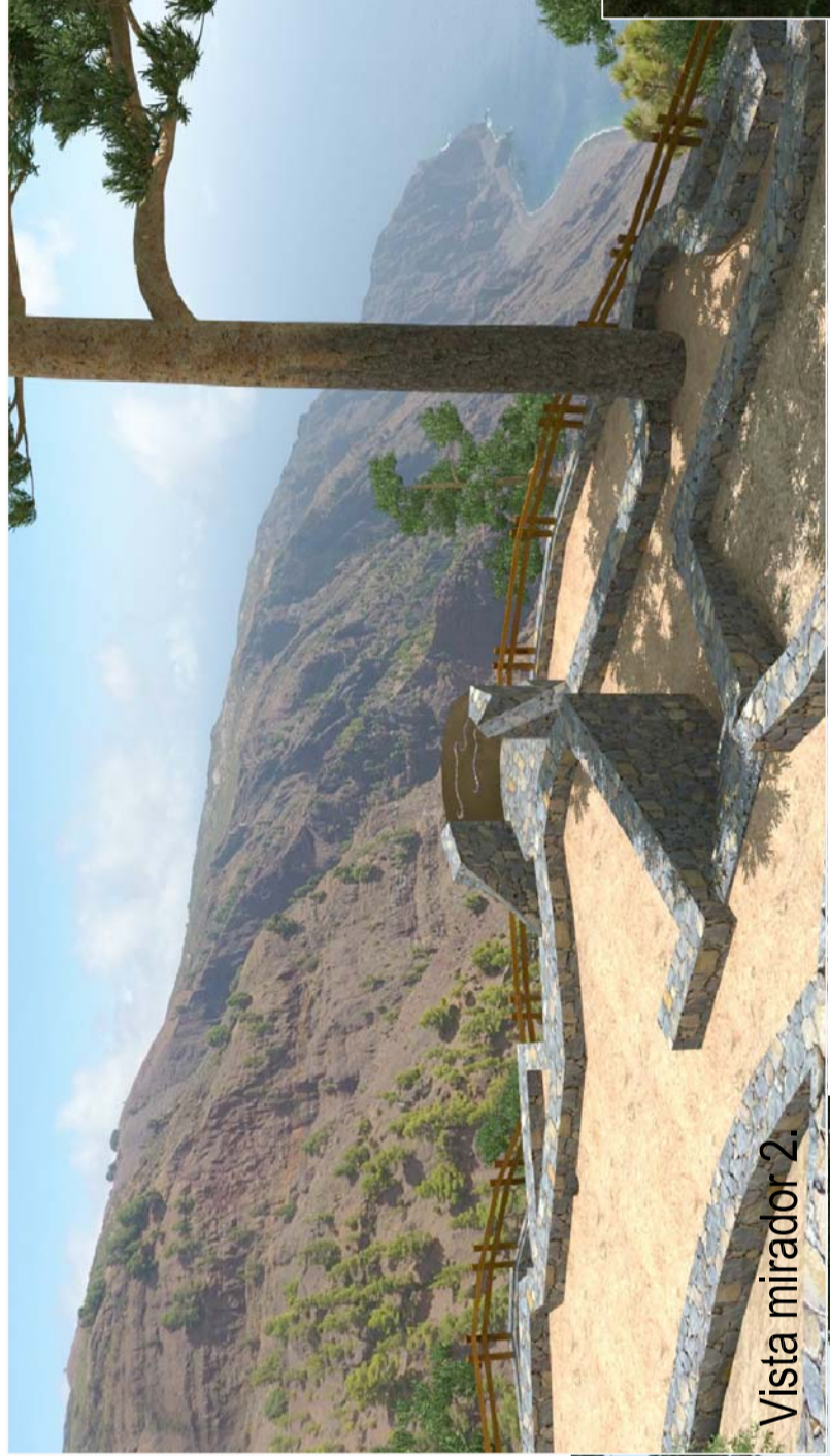
Vista mirador 2.