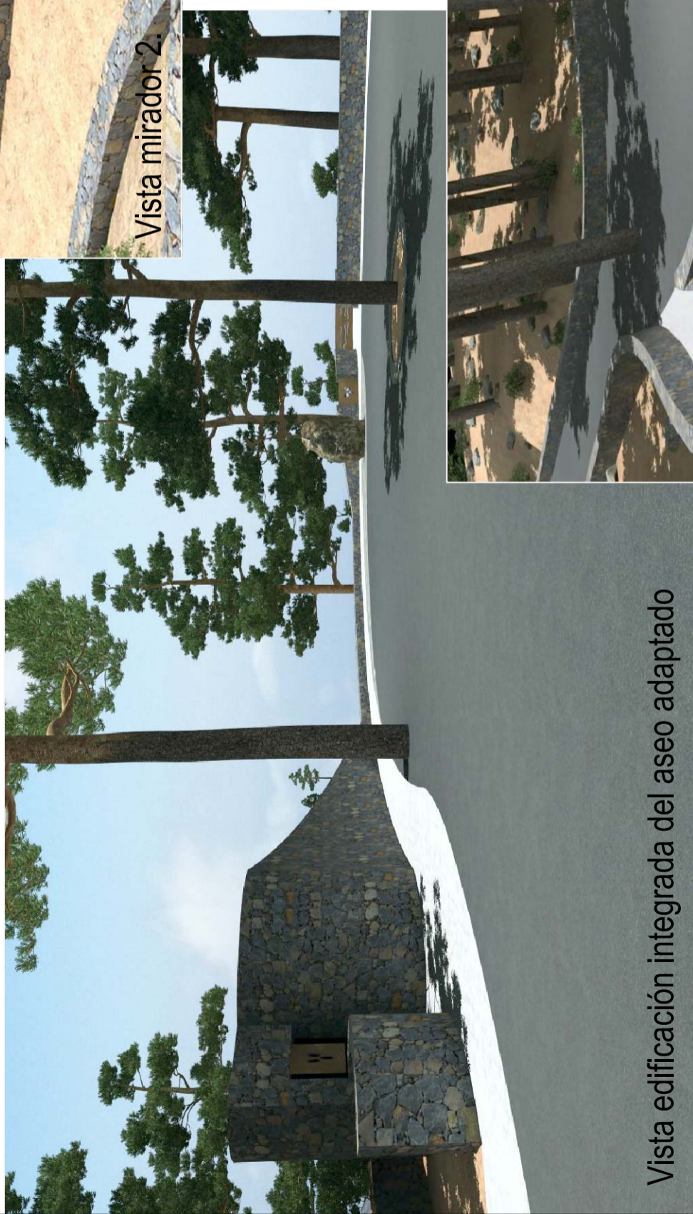
Vista edificación integrada del aseo adaptado