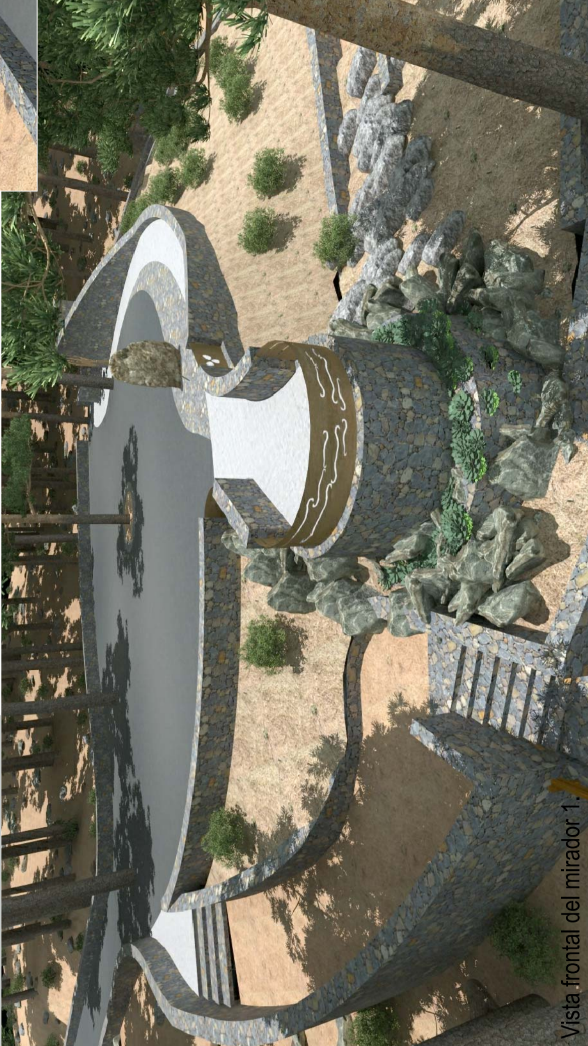
Vista frontal del mirador 1.