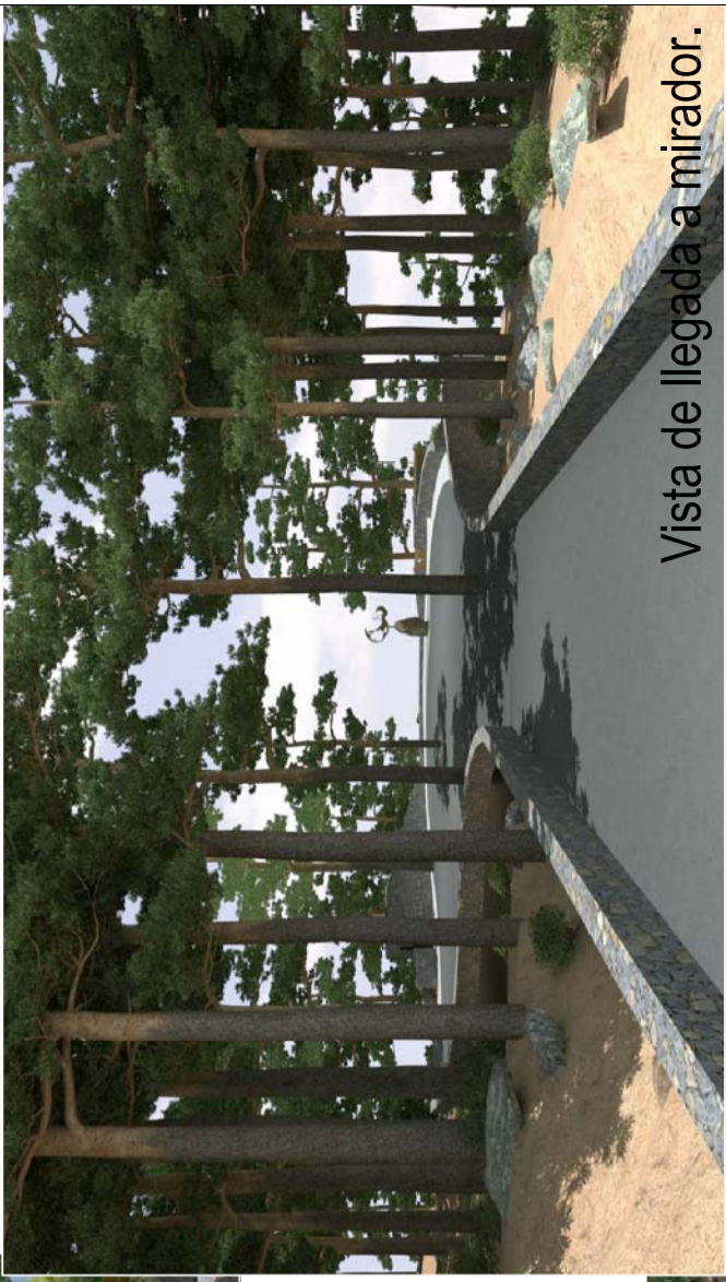
Vista de llegada a mirador.