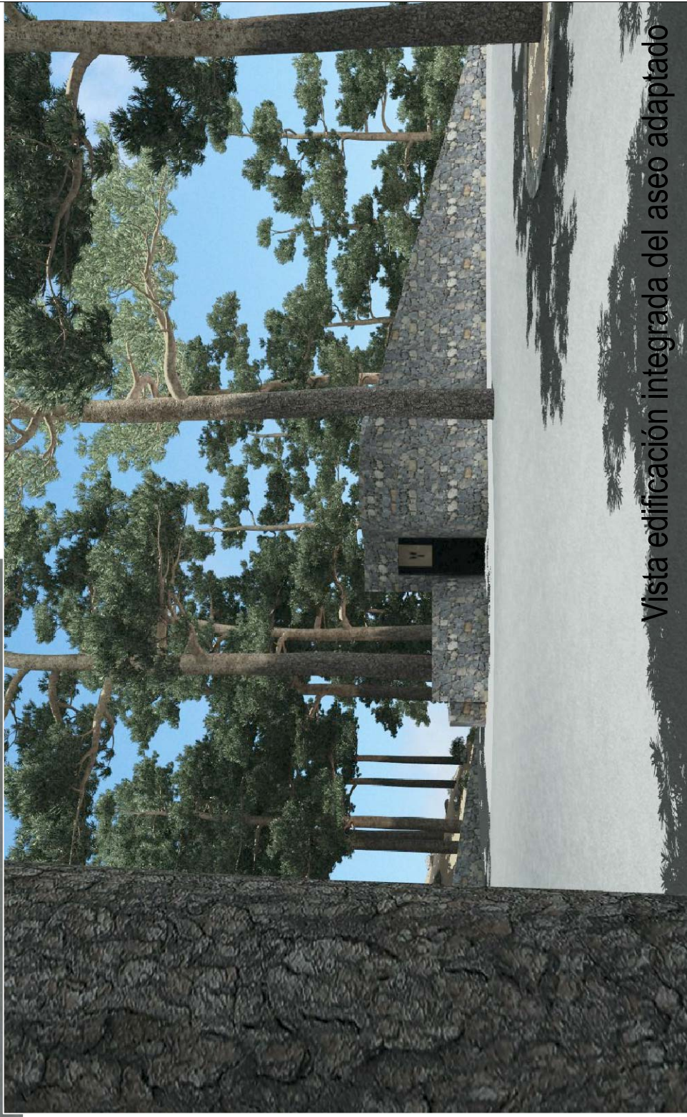
Vista edificación integrada del aseo adaptado