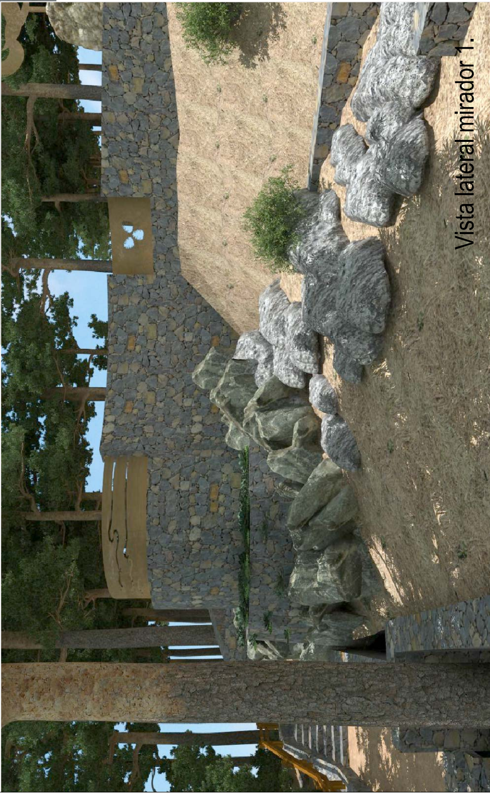
Vista lateral mirador 1.