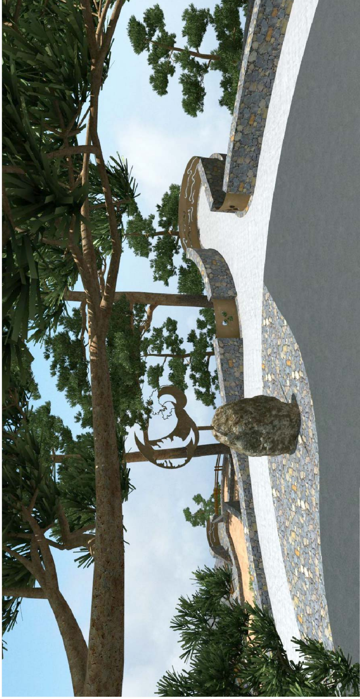
Vista mirador 1 y escultura.