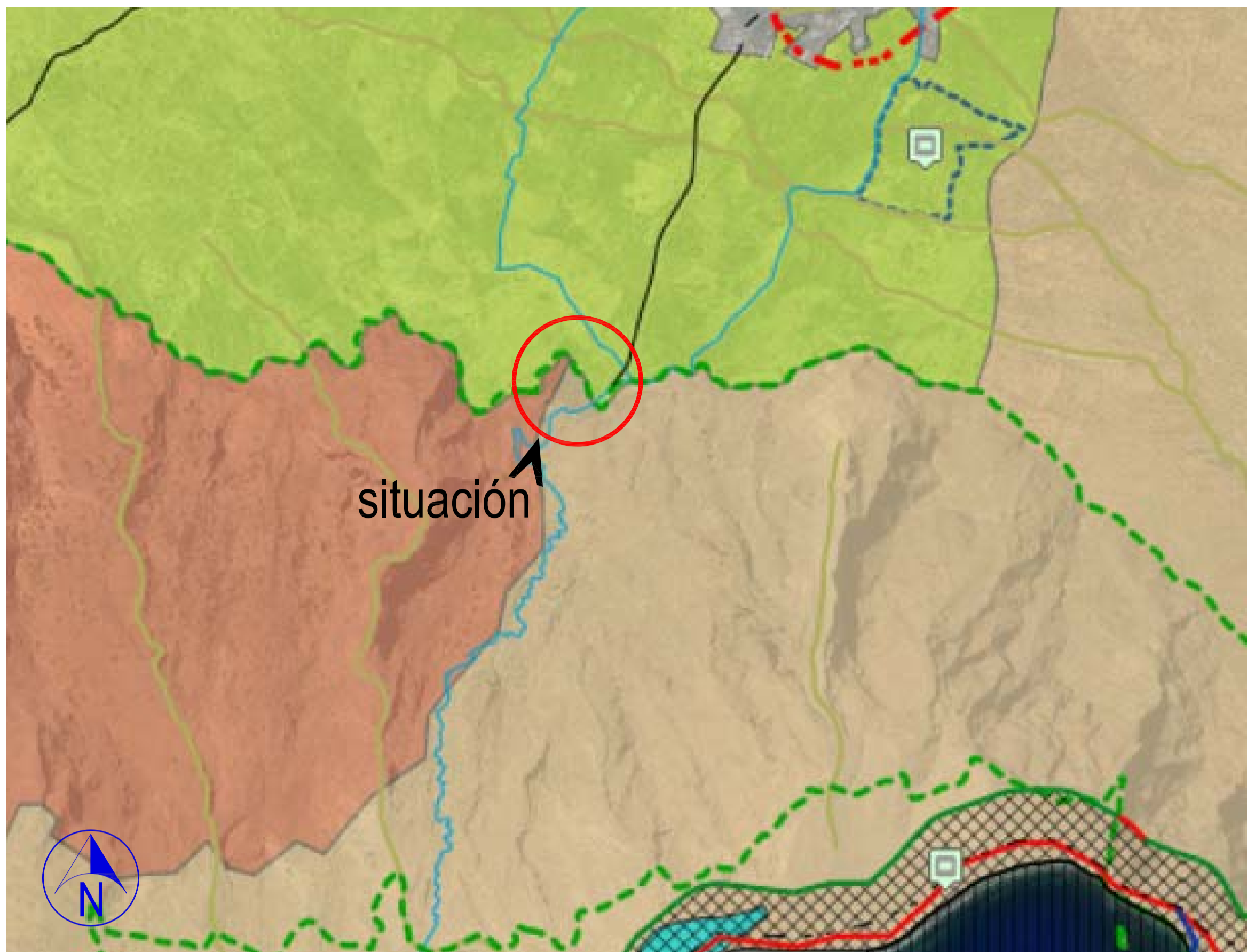
P. I. O. H. Valverde. escala: 1/7500.